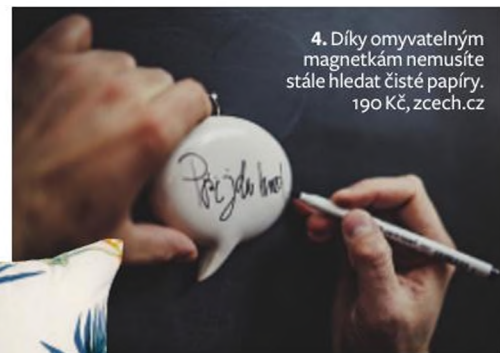
4. Díky omyvatelným magnetkám nemusíte stále hledat čisté papíry. 190 Kč, zcech.cz