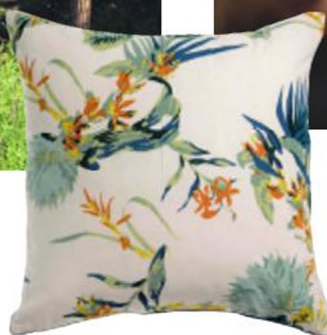
3. Cestování jsme si v posledním roce moc neužili. Přineste si domů exotiku aspoň na vzorech polštářů. 1500 Kč, Le Patio.