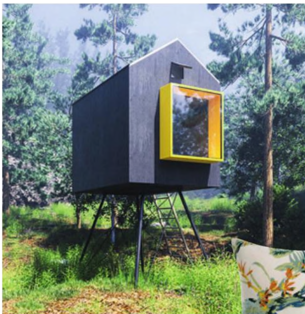
2. Celoročně obyvatelné posedy jsou k vidění v areálu Ski a Bike centra Radotín a u hotelu Farma nedaleko Pelhřimova.