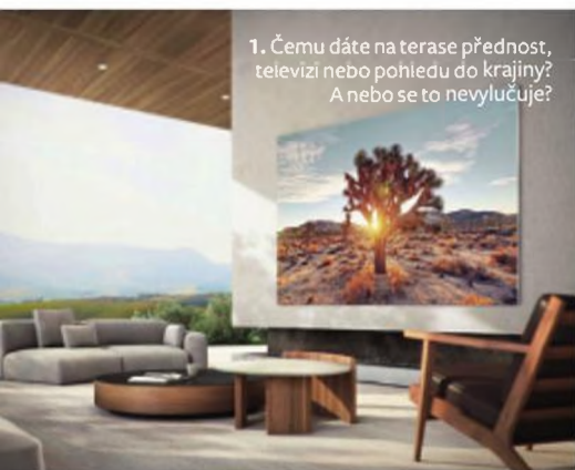
1. Čemu dáte na terase přednost, televizi nebo pohledu do krajiny? A nebo se to nevyklučuje?

M iluji jaro. Obvykle ho cítím ve vzduchu, jakmile odbije silvestrovská půlnoc, a začátkem března je doslova na spadnutí. Jaro ale není jen probouzející se příroda, přináší i spoustu novinek, včetně těch technických. Třeba televizi Samsung MicroLED (1) s úhlopříčkou 280 cm. Dokonalý zvuk a obraz doslova od kraje ke kraji – taky už se vidíte na gaučičku v obýváku nebo na terase?